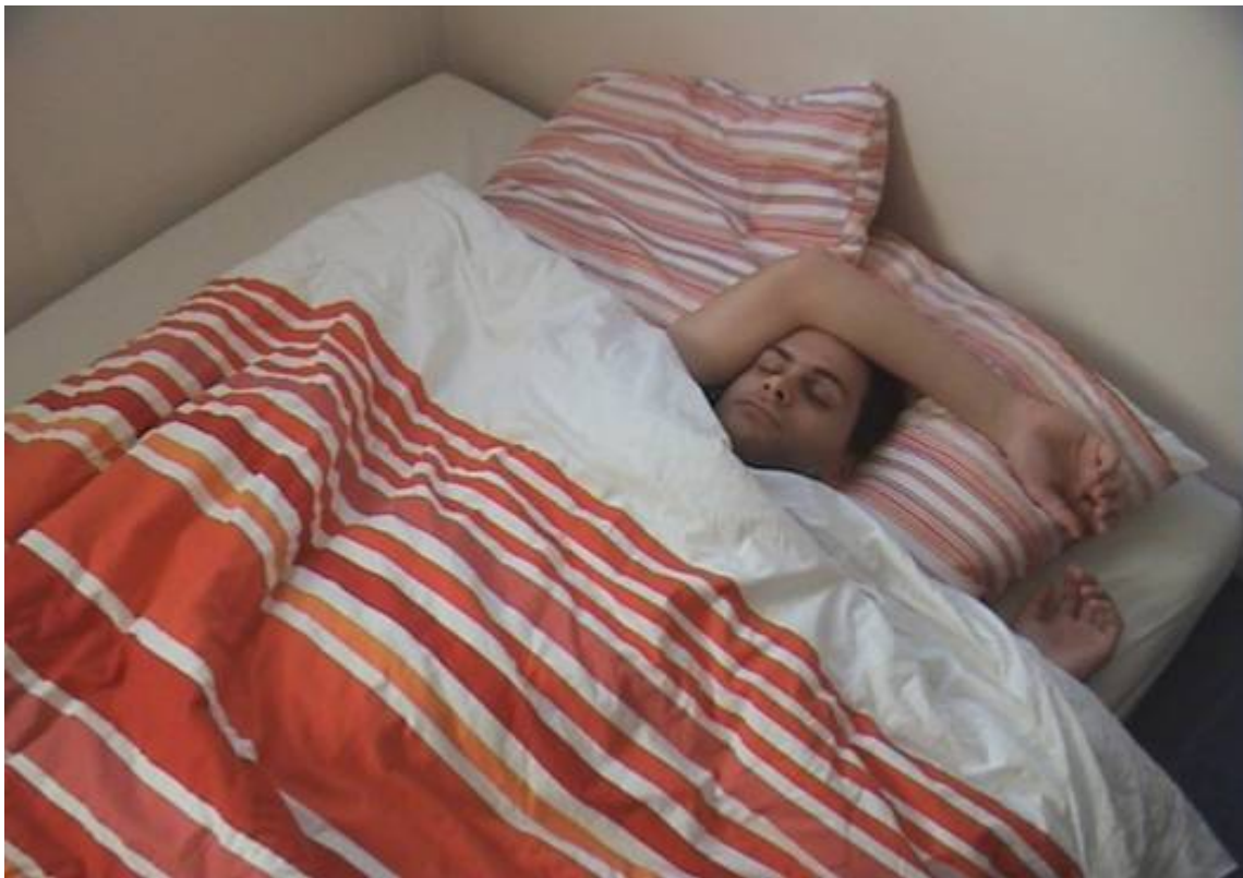
To pretend to sleep - video 1'52"