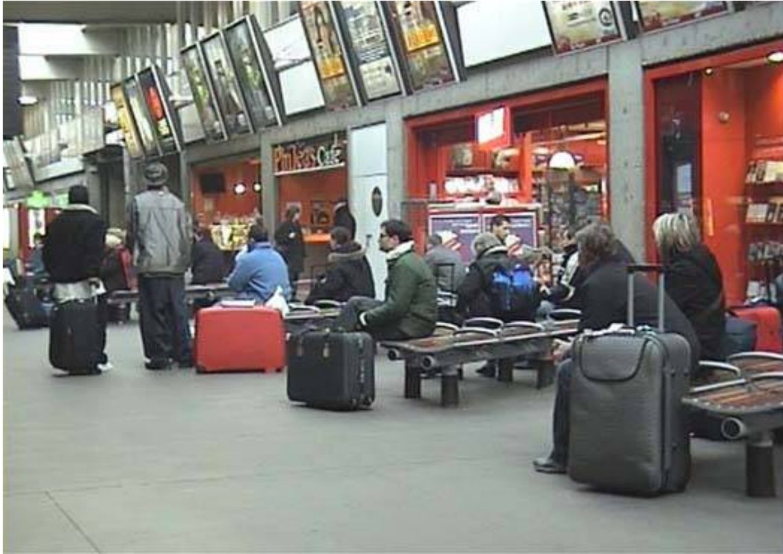
To pretend to go for a trip - video 5'08"