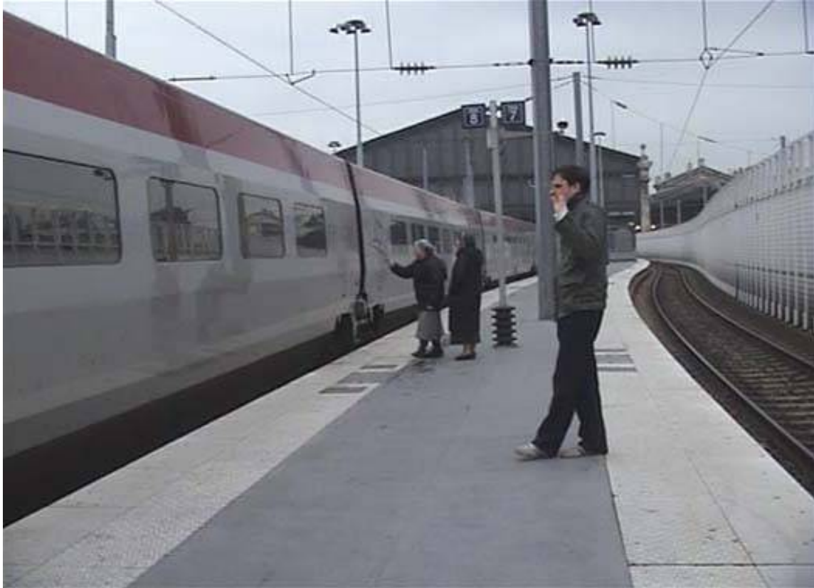
To pretend to say goodbye - video 1'43"