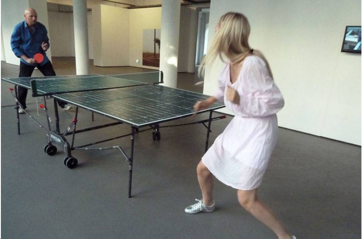
The game on such a table became difficult because of the imperfect reconstruction.